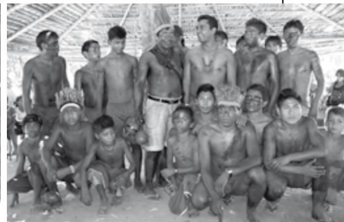
Participantes no encontro de professores indígenas no Maranhão