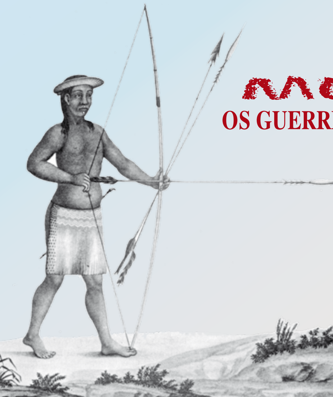
Índio Mura com arco e flecha, desenhado na Viagem Filosófica de Alexandre Rodrigues de Ferreira .

Este episódio desencadeou nova repressão contra este povo. Em 1856, o Mapa Estatístico dos Aldeamentos de Índios , do Império, registrava apenas 1.300 Mura, distribuídos em 8 povoações. Um genocídio pouco lembrado em nossa história. ■